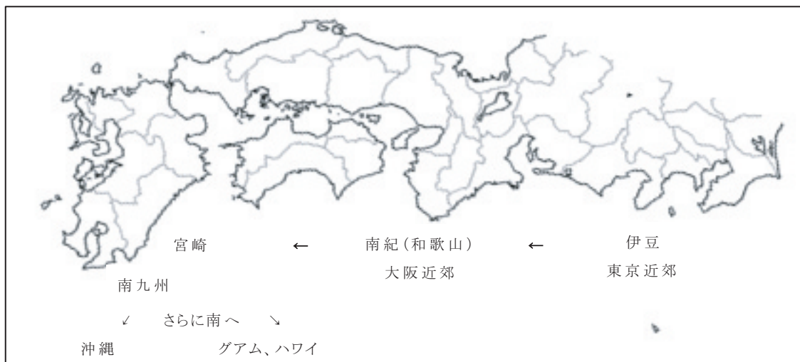
図1 日本における南国

この観点から、東京・大阪から遠く南西にある九州は、「南国ムードを味わえる九州」という位置づけを割り当てられた。一般的に、新婚客は寒い北よりも暖かい南を好み、そこで結婚式の緊張を緩めた。南国ムードは新婚組のパラダイスとして機能したのである。