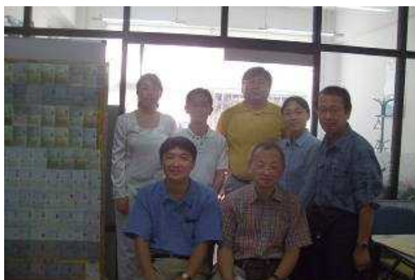
取材終了後、日本五部で、劉部長（後列中央）、通訳してくれた日本五部職員（後列左端）との記念写真

いずれにしても、こうした形式的書類審査を過度に重視すると、偽装業者をはびこらせますます内実の伴わない偽装工作とイタチごっこをすることになりかねない。そんな議論は日本国内でも多く耳にするが、同じような話を大連の留学斡旋業者から聞くことになり、我々も思わずうなずき同感せざるを得なかった。