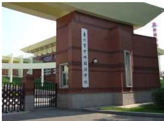
東北育才外国語学校正門