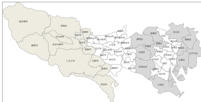
図1：都心からの距離の区分

持ち家住宅の総床面積に関しては、住宅・土地統計が5年に1度の調査であることから、調査年以外の非基準年は別途調整が必要である。住宅・土地統計の持ち家住宅の総床面積を元に、「住宅着工統計」（国土交通省）並びに「建築物除却統計」（国土交通省）を利用して、着工統計による持ち家の増加の床面積と除却統計による減少の床面積を算出し、それらの増減床分を調整し、当該年の持ち家の総床面積を算出する。