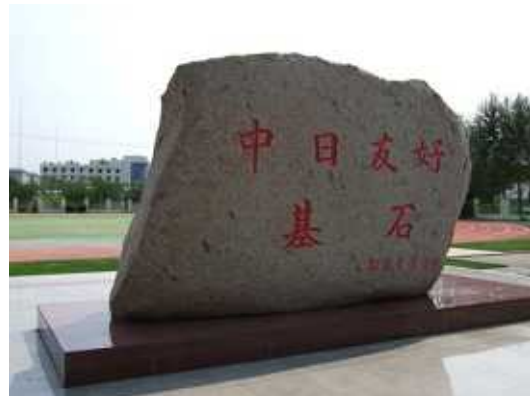
東北育才外国語学校が関西語言学院の支援によって設立されたことを表す記念碑