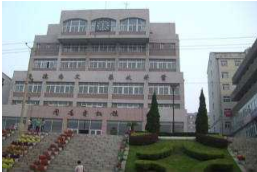
大連外国語学院、大連市内キャンパス