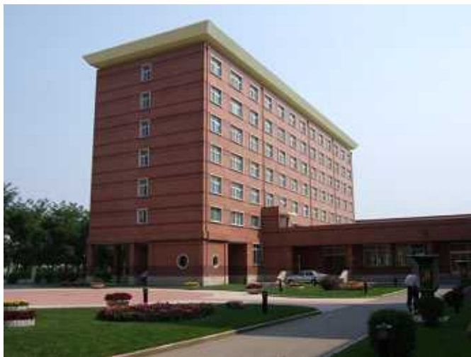
東北育才外国語学校寄宿舎 昼食後の昼寝の時間がある

現在の在學生は過去7期の卒業生よりもレベルが高い。それは中高一貫性になったためである。高等部のみの募集の場合、よい生徒は学費の安い公立に行ってしまう難点があった。