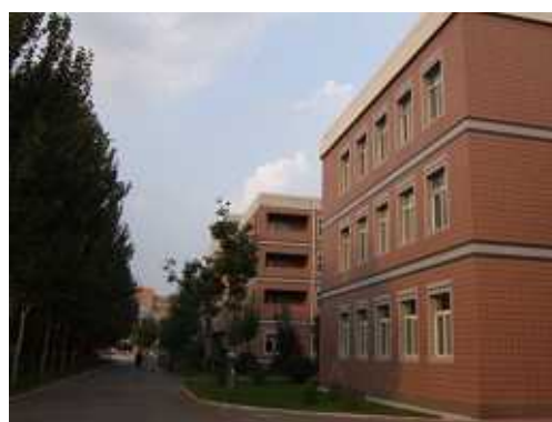
インタビューの行われた校舎（右側）