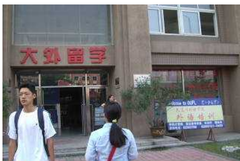
大連外国語学院留学服務中心の入口