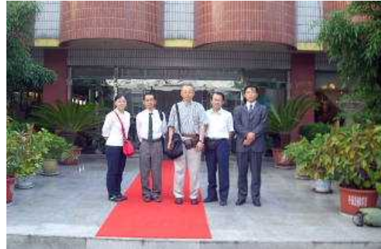
宮日本語学院副院長（右端）と共に