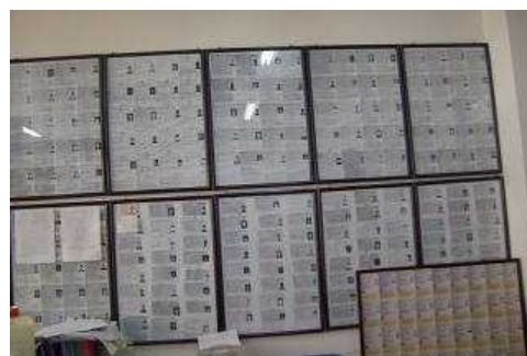
壁一面の「在留資格認定証明書」コピー