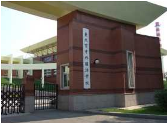
東北育才外国語学校正門