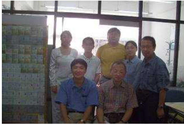
取材終了後、日本五部で、劉部長（後列中央）、通訳してくれた日本五部職員（後列左端）との記念写真

いずれにしても、こうした形式的書類審査を過度に重視すると、偽装業者をはびこらせますます内実の伴わない偽装工作とイタチごっこをすることになりかねない。そんな議論は日本国内でも多く耳にするが、同じような話を大連の留学斡旋業者から聞くことになり、我々も思わずうなずき同感せざるを得なかった。